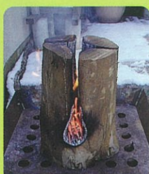
スエーデントーチ