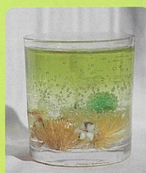
フラワーキャンドル(中)